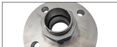
Brida deslizante DN50 (inmersión ajustable)