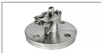
Brida fija DN50 soldada al cuerpo