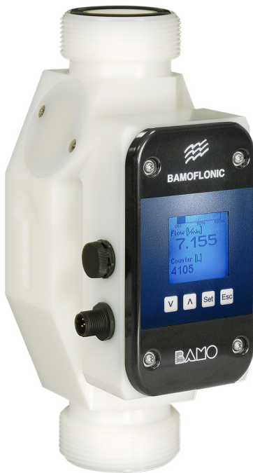
Modelo PEAD (DN32 a 50)