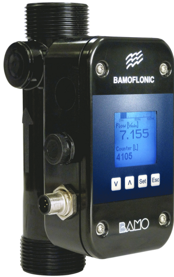
Modelo PPSU (DN 10 a 25)